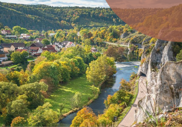
Donautal bei Gutenstein, Sigmaringen, Foto von Patrick Pahlke auf Unsplash

Grundsätzlich , bitte ich alle Teilnehmer darum sich bei mir anzumelden.